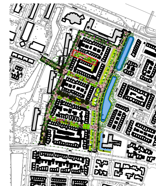
OVERZICHTSTEKENING SCHAAL geen