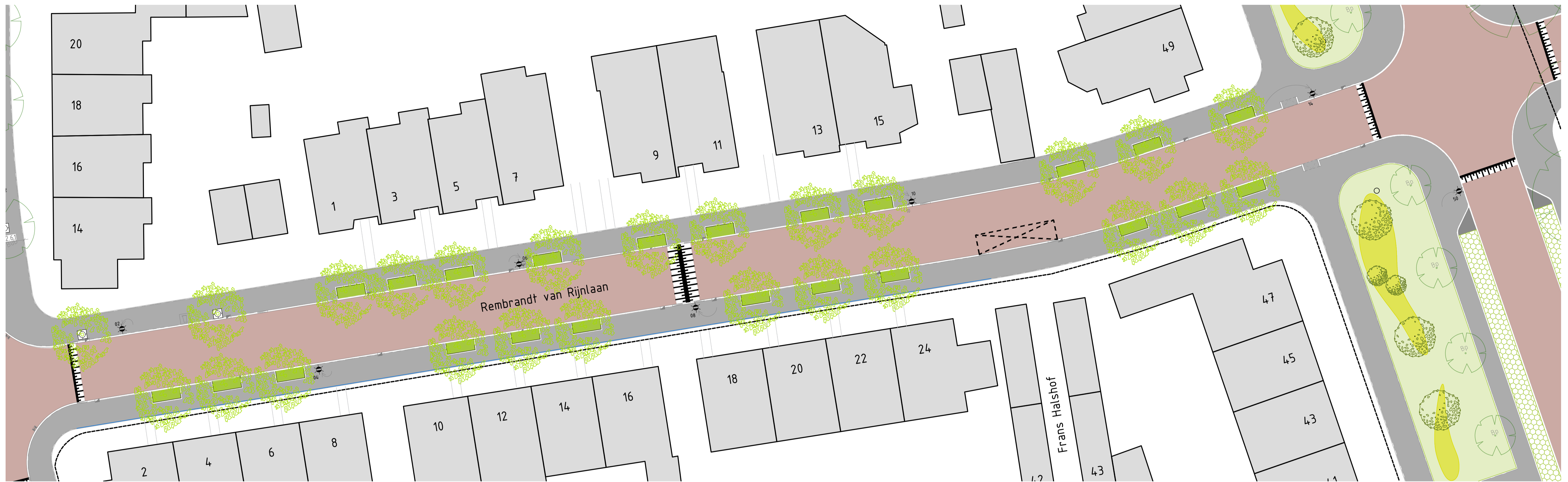
OVERZICHTSTEKENING SCHAAL 1:200

Locatie: Rembrandt van Rijnlaan: 1e Optie - bomen, 1e keuze