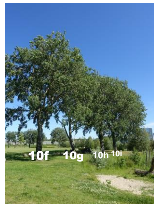
Boom 10f - 10i