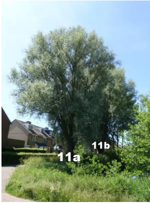
Boom 11a - 11b