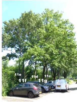
Boom 11c - 11g