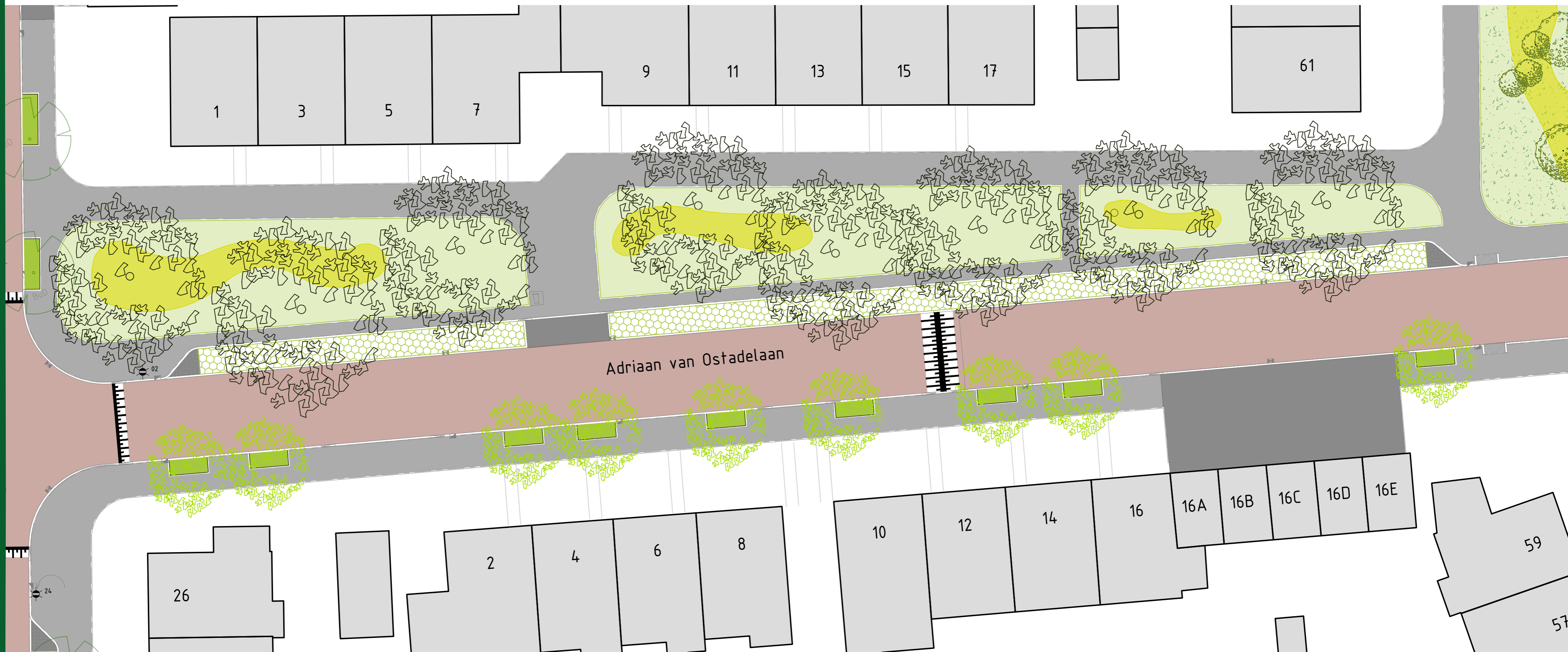
OVERZICHTSTEKENING SCHAAL 1:200

Locatie: Adriaan van Ostadelaan: 1e Optie - bomen, 1e keuze