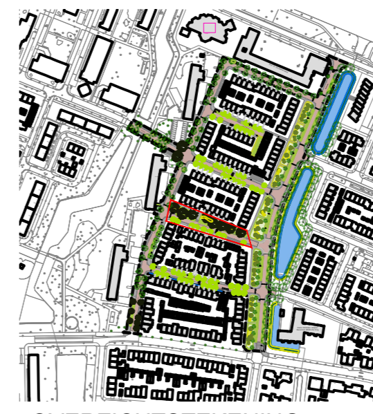
OVERZICHTSTEKENING SCHAAL geen

A. van Ostadelaan Uitstraling: Roodbloeiende- Roodbladige bomen en roodbloeiende onderbeplanting Aan de onevenzijde (nr. 1 - nr. 17) Boomsoort: Noorse esdoorn - Acer platanoides 'Faasens Black' Hoogte boom 15-20 meter in de gazonstrook slingerende vakken met rood bloeiende vaste planten Aan de evenzijde (nr. 2- nr. 16) Boomsoort: veldesdoorn - Acer campestre 'Red shine'