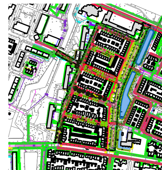
OVERZICHTSTEKENING SCHAAL geen