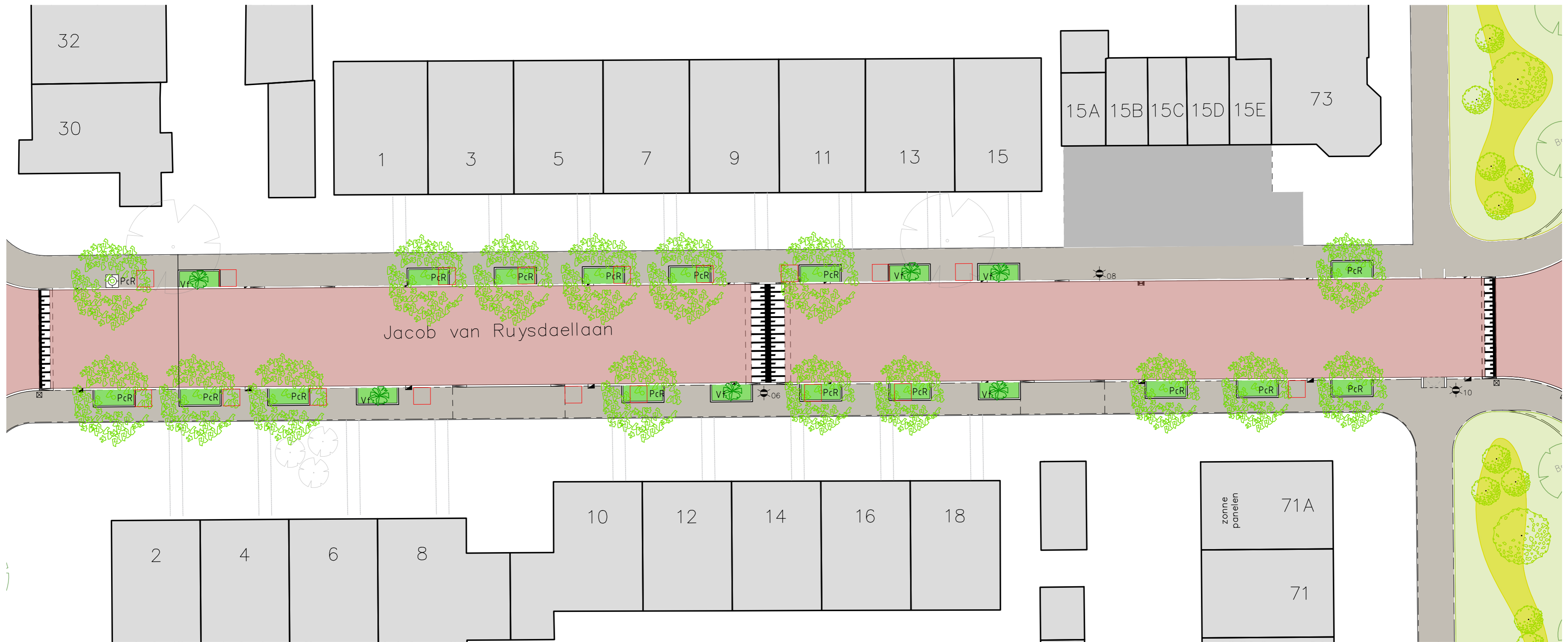
OVERZICHTSTEKENING SCHAAL 1:200