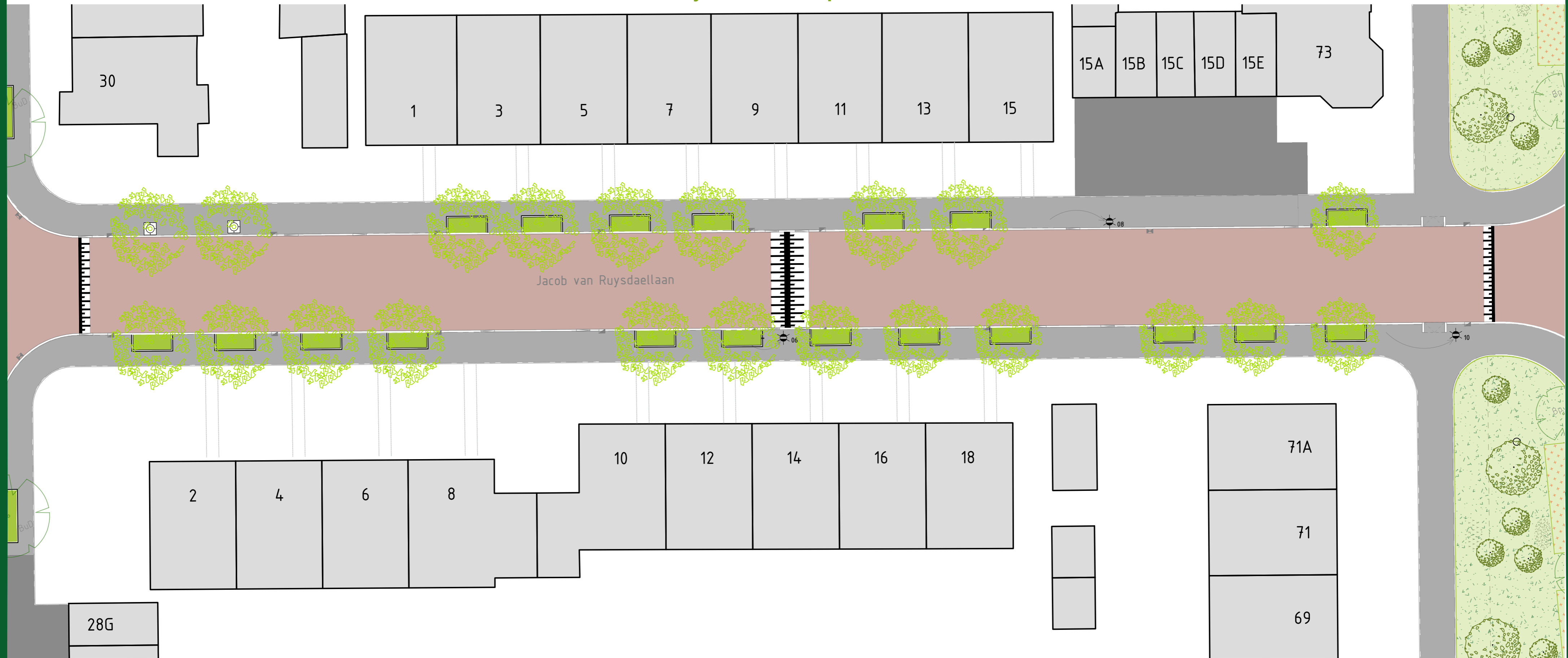
OVERZICHTSTEKENING SCHAAL 1:200

Locatie: Jacob Ruysdaellaan: 2e Optie - bomen, 2e keuze