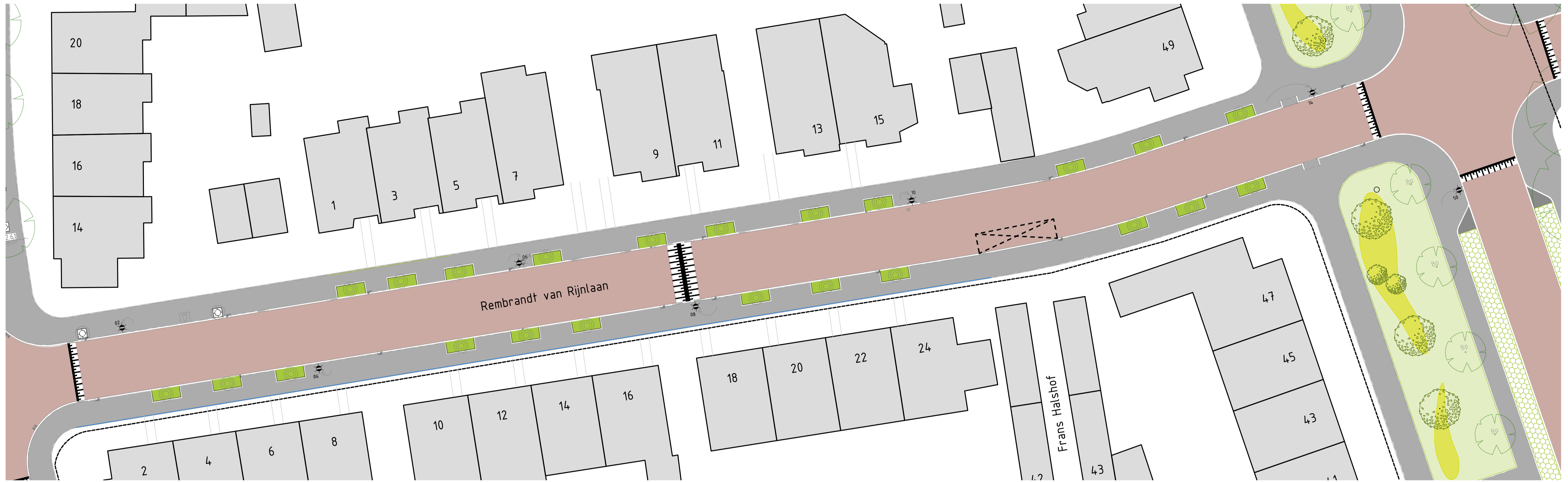
OVERZICHTSTEKENING SCHAAL 1:200

Locatie: Rembrandt van Rijnlaan: 3e Optie - klimplantconstructie met klimplanten