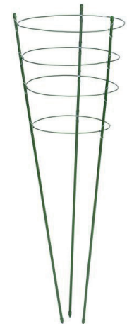
Staander in metaal (ter indicatie)