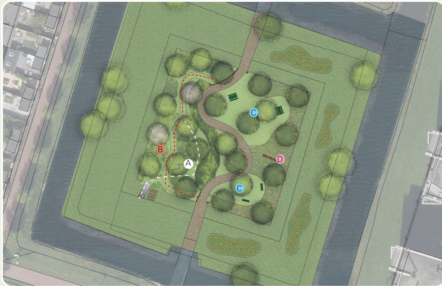
A Het avonturenpad