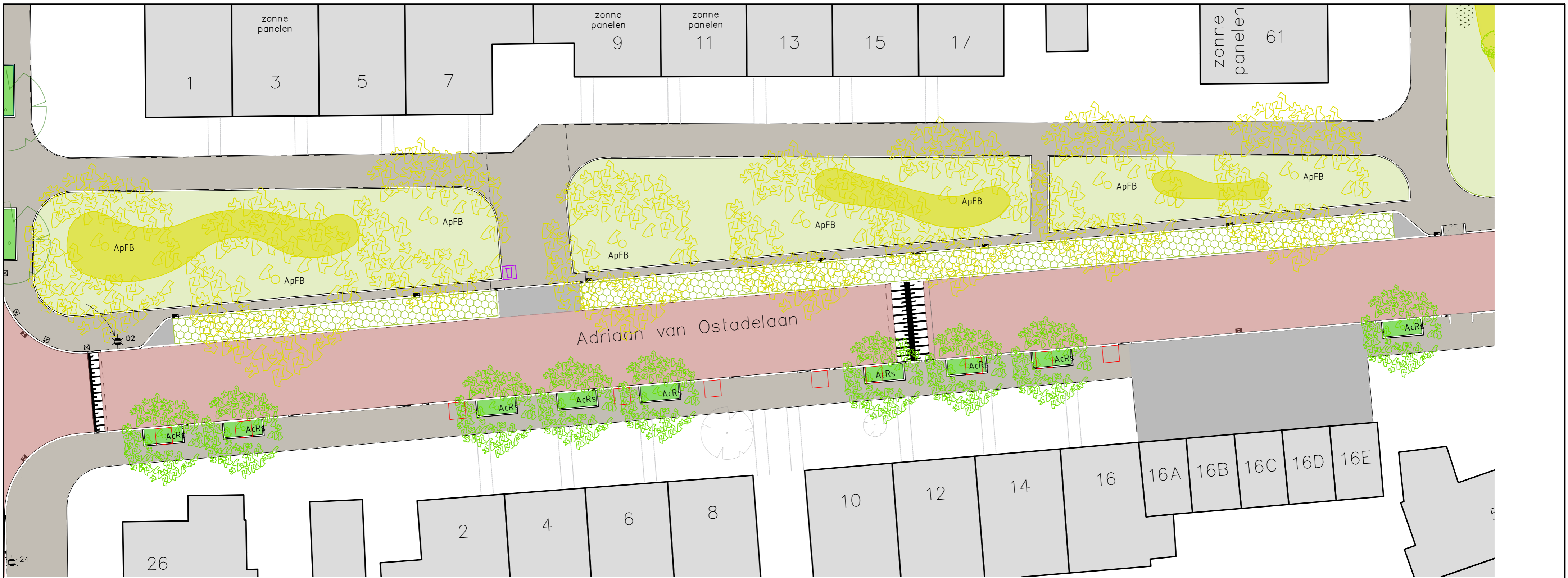
OVERZICHTSTEKENING SCHAAL 1:200