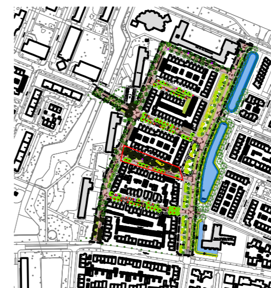
OVERZICHTSTEKENING SCHAAL geen