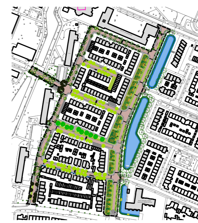
OVERZICHTSTEKENING SCHAAAL 1:500