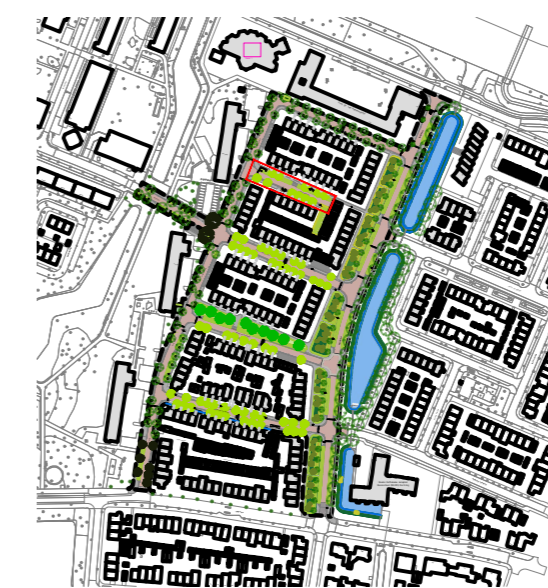
OVERZICHTSTEKENING SCHAAL geen